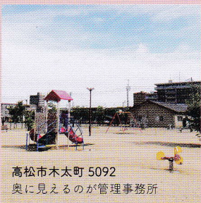
高松市木太町 5092 奥に見えるのが管理事務所