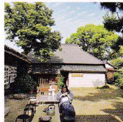
江戸時代末期から続く水車場